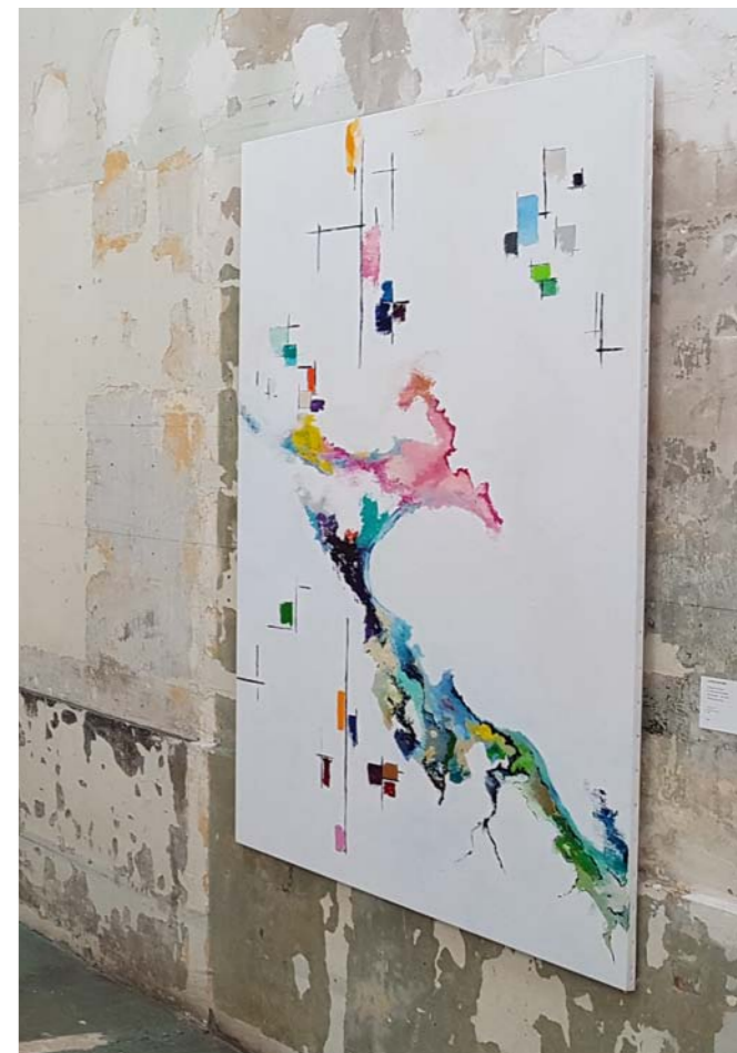
La Ville Éclatée - Territoire / 195 x 130 cm