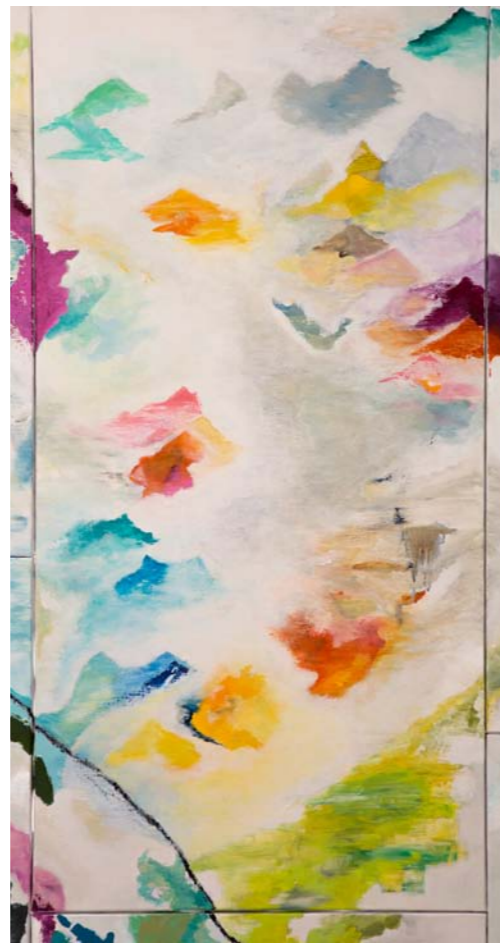
N°5 : «La Montagne Magique» - 120 x 60 cm