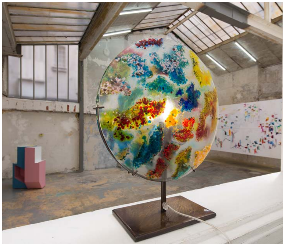
«Autour du Monde» - Lampe sur table / Verre en fusion et laiton bruni / Murano, Italie