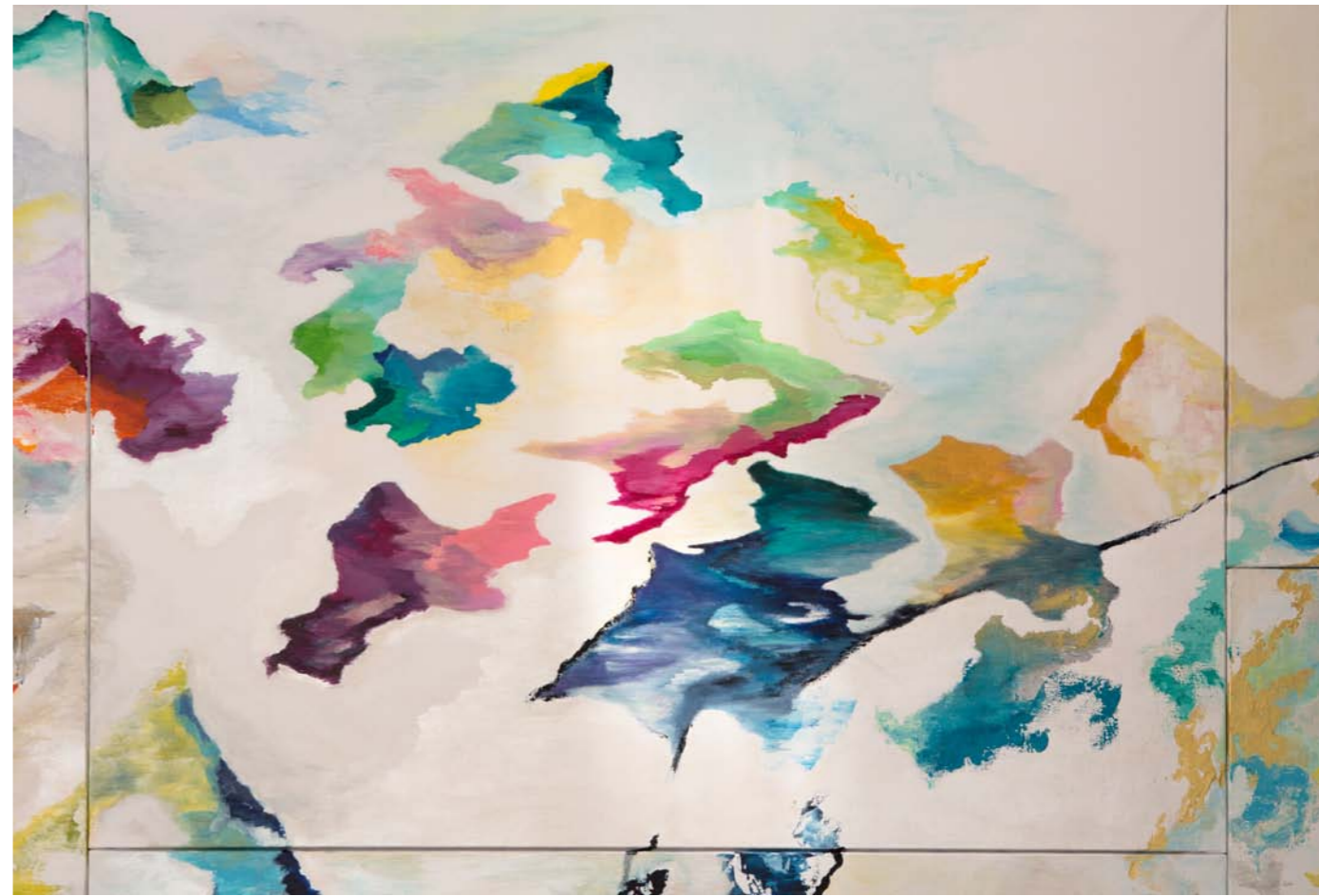
Panneau N°3 : «Panorama» - 97 x 130cm