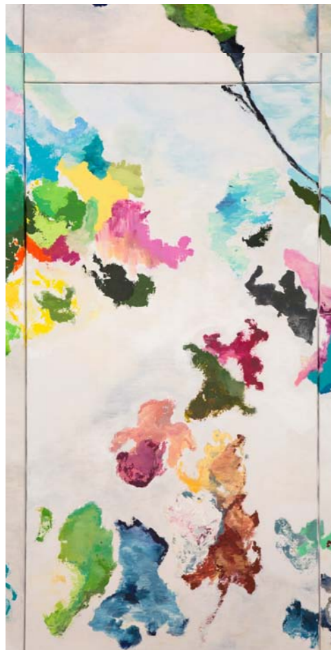
Panneau N°8 : «Festi-Val» - 120 x 60 cm