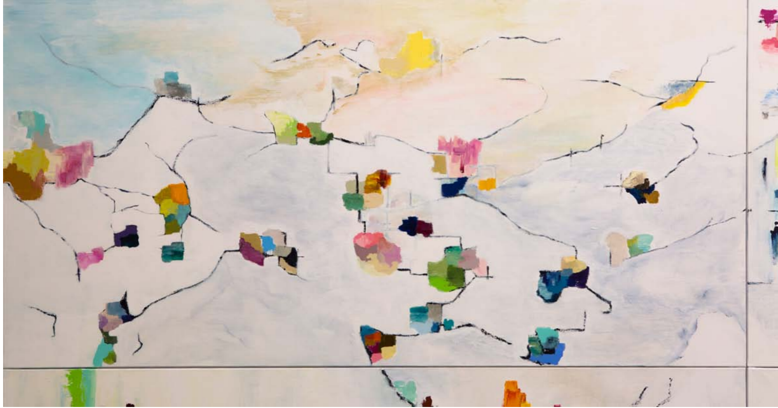
Panneau N°15 : «Dispersion» - 97 x 195cm