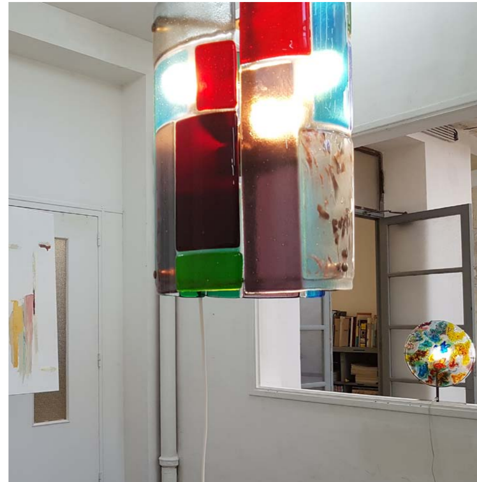
«Trifeuilles» - Suspension à trois pans / Verre en fusion et laiton bruni / Murano, Italie