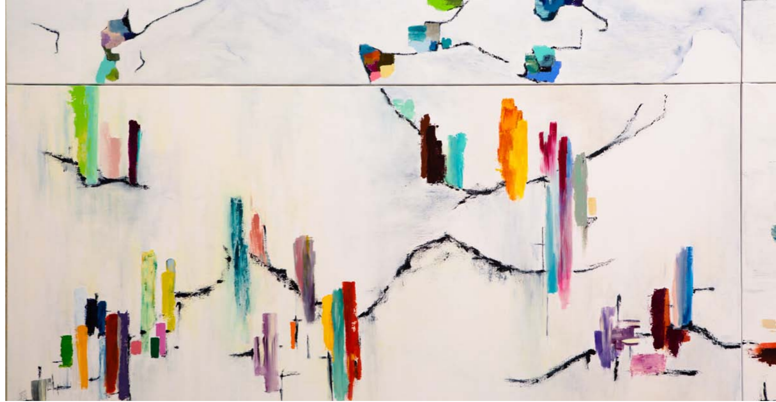
Panneau N°16 : «Fondations» - 97 x 195cm