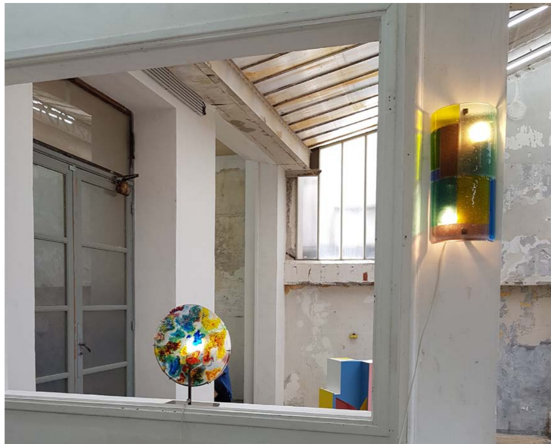
«Unique» - Applique