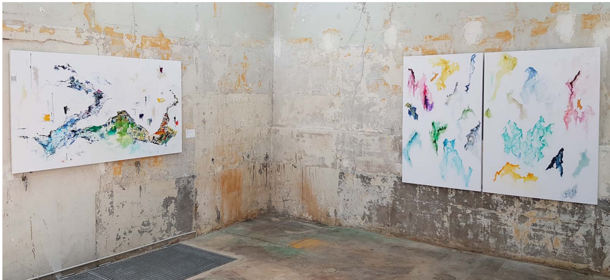
Villes d'Eau - Territoire / 114 x 195 cm