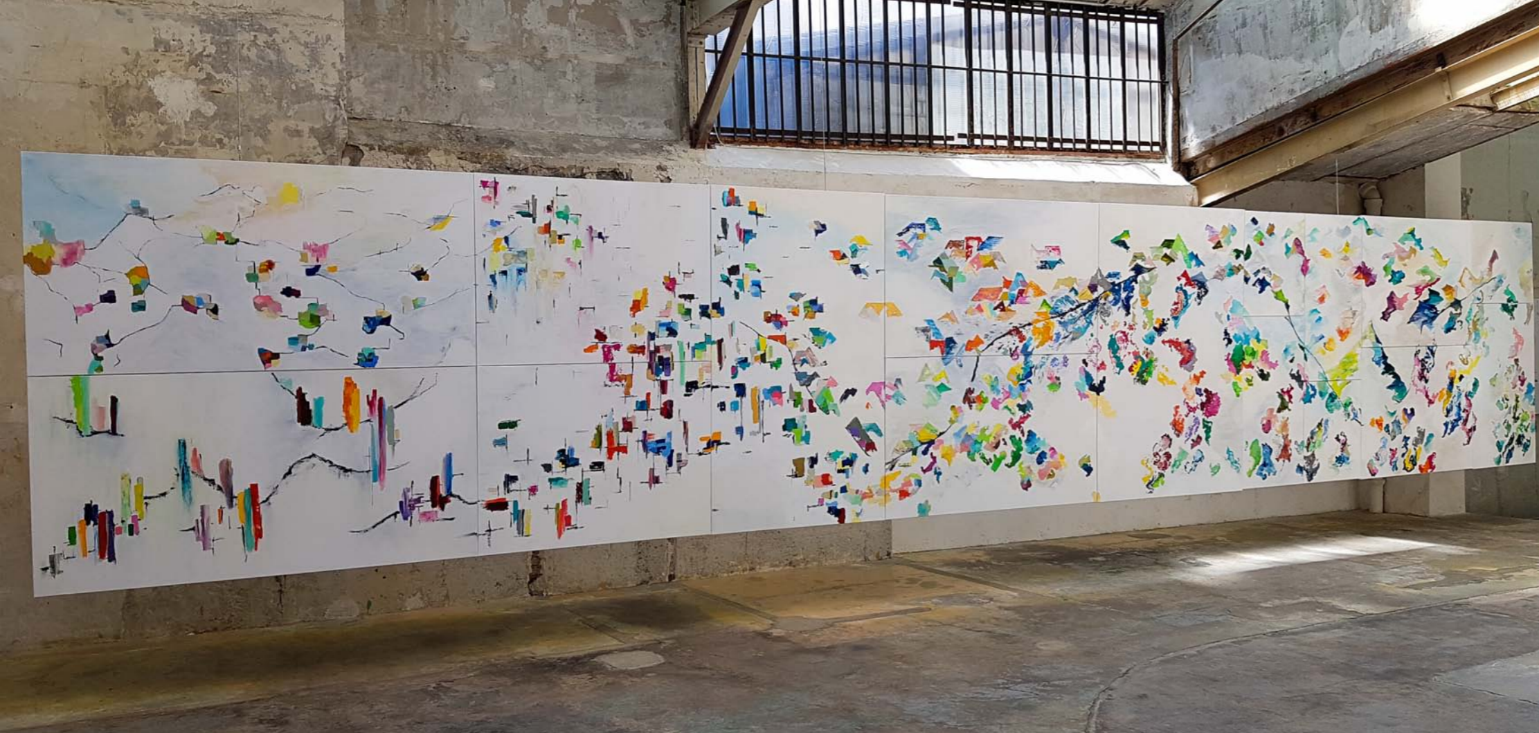
Récital A16 - Polyptyque A 16 toiles Composition de 2m x 11m - Acrylique sur Toile - 2018